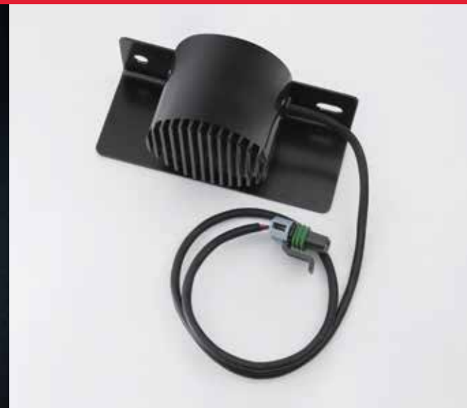
Alarme de recul