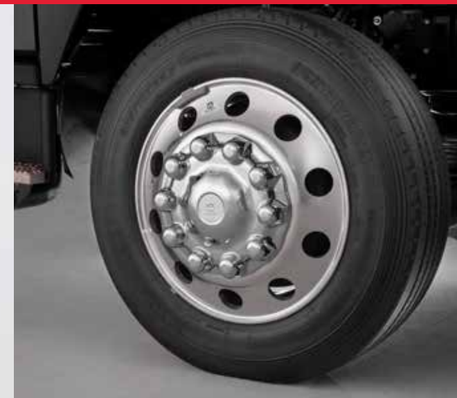
Pneus à profil bas.