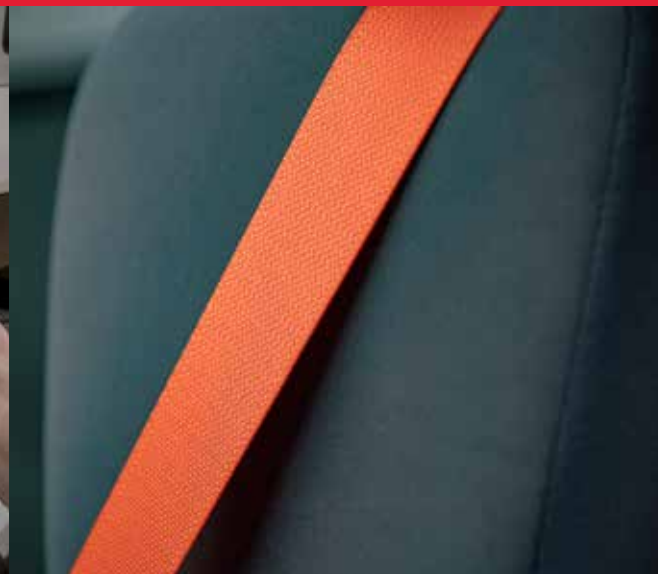
Ceintures de sécurité haute visibilité