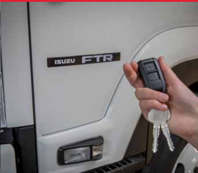
Accès sans clé